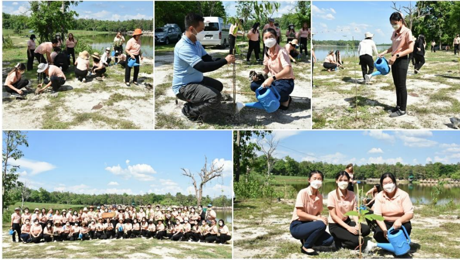
สตท.7 จัดกิจกรรมวันต้นไม้ประจำปีของชาติ ประจำปี 2566

วันที่ 2 มิถุนายน 2566 สำนักงานตรวจบัญชีสหกรณ์ที่ 7 จัดกิจกรรมวันต้นไม้ประจำปีของชาติ ประจำปี 2566 เพื่อเป็นการสร้างและกระตุ้นจิตสำนึกของประชาชนและเจ้าหน้าที่ในหน่วยงานให้เห็นความสำคัญของการอนุรักษ์และฟื้นฟูทรัพยากรป่าไม้ของชาติ โดยร่วมกันปลูกต้นไม้ ณ บริเวณอ่างเก็บน้ำห้วยตึงเฒ่า ตำบลดอนแก้ว อำเภอแม่ริม จังหวัดเชียงใหม่