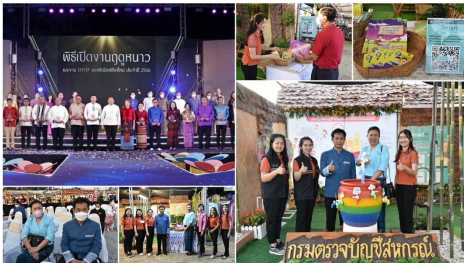
สตท.7 ร่วมพิธีเปิดงานฤดูหนาวและงาน OTOP ของดีเมืองเชียงใหม่ ประจำปี 2566

วันที่ 3 ธันวาคม 2565 สำนักงานตรวจบัญชีสหกรณ์ที่ 7 ร่วมพิธีเปิดงาน "โครงการหลวง 2565" เพื่อเป็นการน้อมรำลึกพระมหากรุณาธิคุณของพระบาทสมเด็จพระบรมชนกาธิเบศร มหาภูมิพลอดุลยเดชมหาราช บรมนาถบพิตร ผู้ทรงก่อตั้งมูลนิธิโครงการหลวง ภายใต้แนวคิด "สุขภาพดี ชีวิตสุขสันต์ กับผลิตภัณฑ์โครงการหลวง" ณ อาคารนิทรรศการ 2 อุทยานหลวงราชพฤกษ์ อำเภอเมือง จังหวัดเชียงใหม่