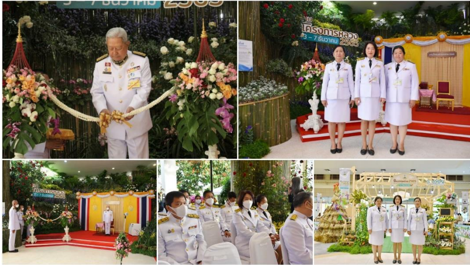
สตท.7 เข้าร่วมพิธีเปิดงาน "โครงการหลวง 2565"

วันที่ 3 ธันวาคม 2565 สำนักงานตรวจบัญชีสหกรณ์ที่ 7 ร่วมพิธีเปิดงาน "โครงการหลวง 2565" เพื่อเป็นการน้อมรำลึกพระมหากรุณาธิคุณของพระบาทสมเด็จพระบรมชนกาธิเบศร มหาภูมิพลอดุลยเดชมหาราช บรมนาถบพิตร ผู้ทรงก่อตั้งมูลนิธิโครงการหลวง ภายใต้แนวคิด "สุขภาพดี ชีวิตสุขสันต์ กับผลิตภัณฑ์โครงการหลวง" ณ อาคารนิทรรศการ 2 อุทยานหลวงราชพฤกษ์ อำเภอเมือง จังหวัดเชียงใหม่