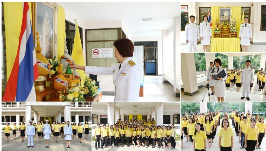
สตท.7 จัดพิธีถวายสัตย์ปฏิญาณเพื่อเป็นข้าราชการที่ดีและพลังของแผ่นดิน ประจำปี 2566

วันที่ 2 มิถุนายน 2566 สำนักงานตรวจบัญชีสหกรณ์ที่ 7 จัดกิจกรรมวันต้นไม้ประจำปีของชาติ ประจำปี 2566 เพื่อเป็นการสร้างและกระตุ้นจิตสำนึกของประชาชนและเจ้าหน้าที่ในหน่วยงานให้เห็นความสำคัญของการอนุรักษ์และฟื้นฟูทรัพยากรป่าไม้ของชาติ โดยร่วมกันปลูกต้นไม้ ณ บริเวณอ่างเก็บน้ำห้วยตึงเฒ่า ตำบลดอนแก้ว อำเภอแม่ริม จังหวัดเชียงใหม่